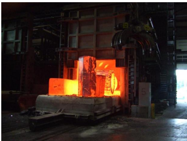
Blöcke bei 1250°C Schmiedetemperatur

Ein heißes Eisen war Dirostahl schon vor über 400 Jahren, als alles in den engen Tälern des Bergischen Landes begann. Als Familienunternehmen verfügt Dirostahl über eine jahrhundertelange Schmiedetradition.